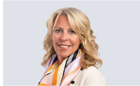
Petra Axdorff Tarkastusvaliokunta 26 739 osaketta